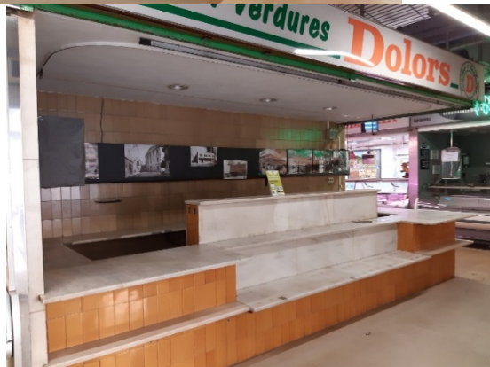
Lot L20 (Parades 35 – 36)