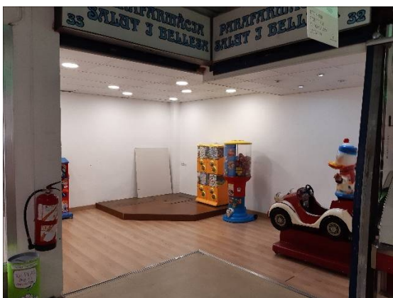
Lot L18 (Parades 32-33)