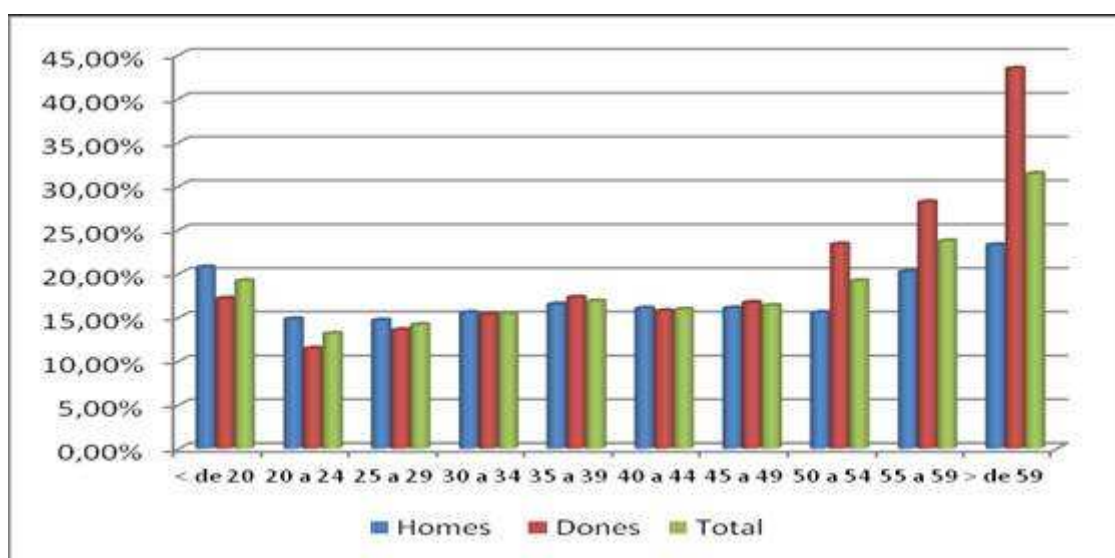
Gràfic. Taxa d'atur per edats a Granollers, 2011.