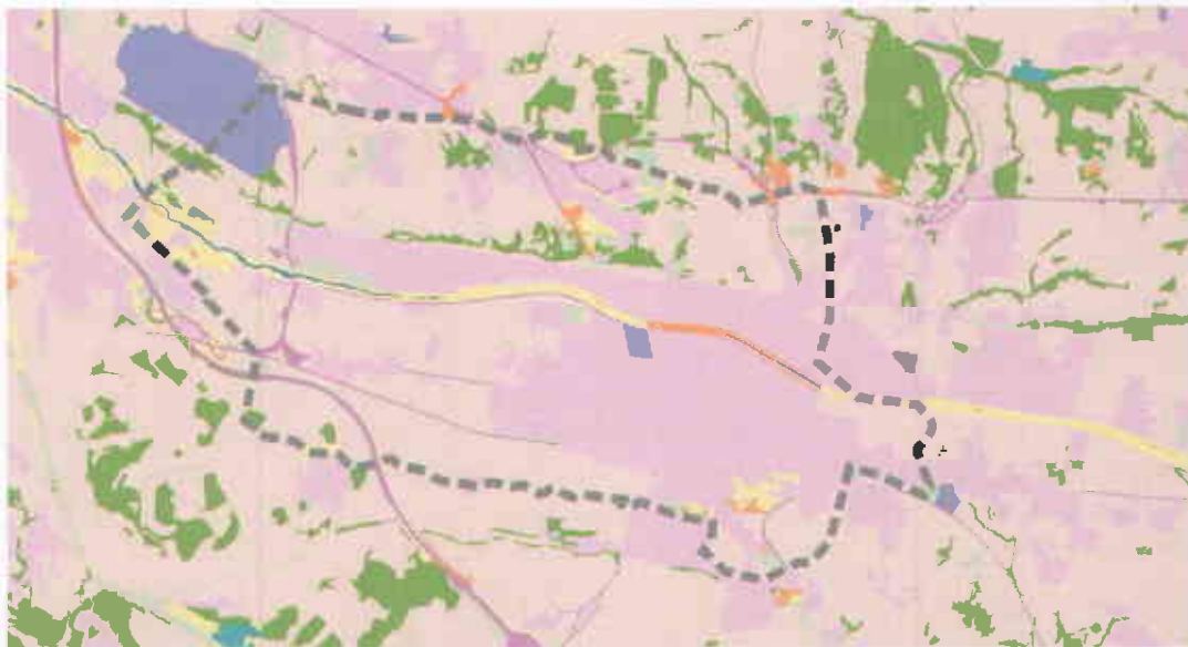
Mapa de cobertes del sòl (CREAF, 1993). El color rosa indica les zones urbanes i el color marró els espais agrícoles.

Les dades anteriors no s'han d'interpretar de manera equívoca, ja que la valoració de la poca representació dels espais boscosos al terme de Granollers no s'ha de fer tant a partir de dades quantitatives com de l'anàlisi de la seva evolució en els darrers anys i de la seva interacció amb els espais agrícoles, que com ja s'ha vist tenen un notable valor ecològic i paisatgístic.